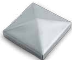
400 КРЫШКА ДЛЯ СТОЛБА КВАДРАТНАЯ