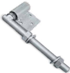
852 ПЕТЛЯ СКВОЗНАЯ