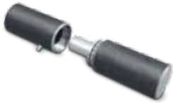
822 ПЕТЛЯ С ОПОРНЫМ ПОДШИПНИКОМ