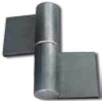
832 ПЕТЛЯ УСИЛЕННАЯ