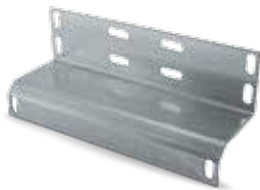
035 КРОНШТЕЙН ЛОВИТЕЛЯ

Компания РОЛТЭК разработала систему столбов и закладных, облегчающую монтаж откатных ворот. Система прекрасно себя зарекомендовала при монтаже сборных модульных откатных ворот торговой марки Skill!. Все элементы совместимы и имеют необходимую перфорацию. Сборка и монтаж системы не требуют применения сварки. Т-система столбов и закладных совместима с любой из систем откатных ворот РОЛТЭК: ЭКО, ЕВРО, МАКС НОВЫЙ. Каждый элемент системы может использоваться самостоятельно.