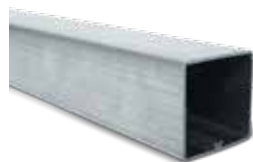
450 СТОЛЬ КЛАССИК