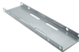
050 КРОНШТЕЙН ДВОЙНОЙ